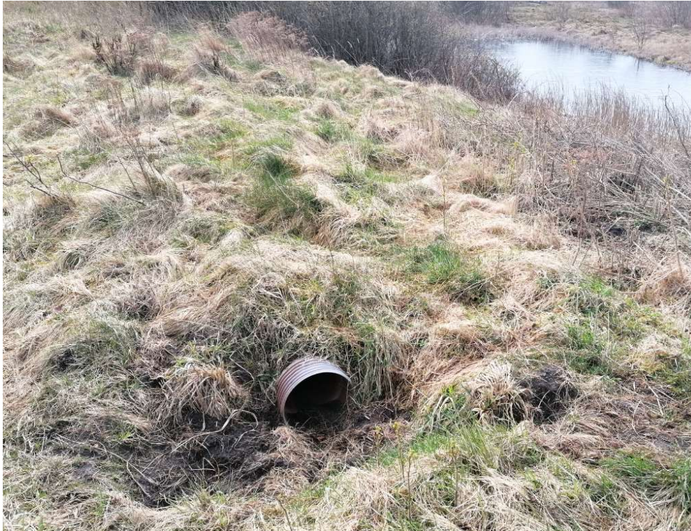
Foto 9. april 2021. Rævegravens vestvendte munding ses.