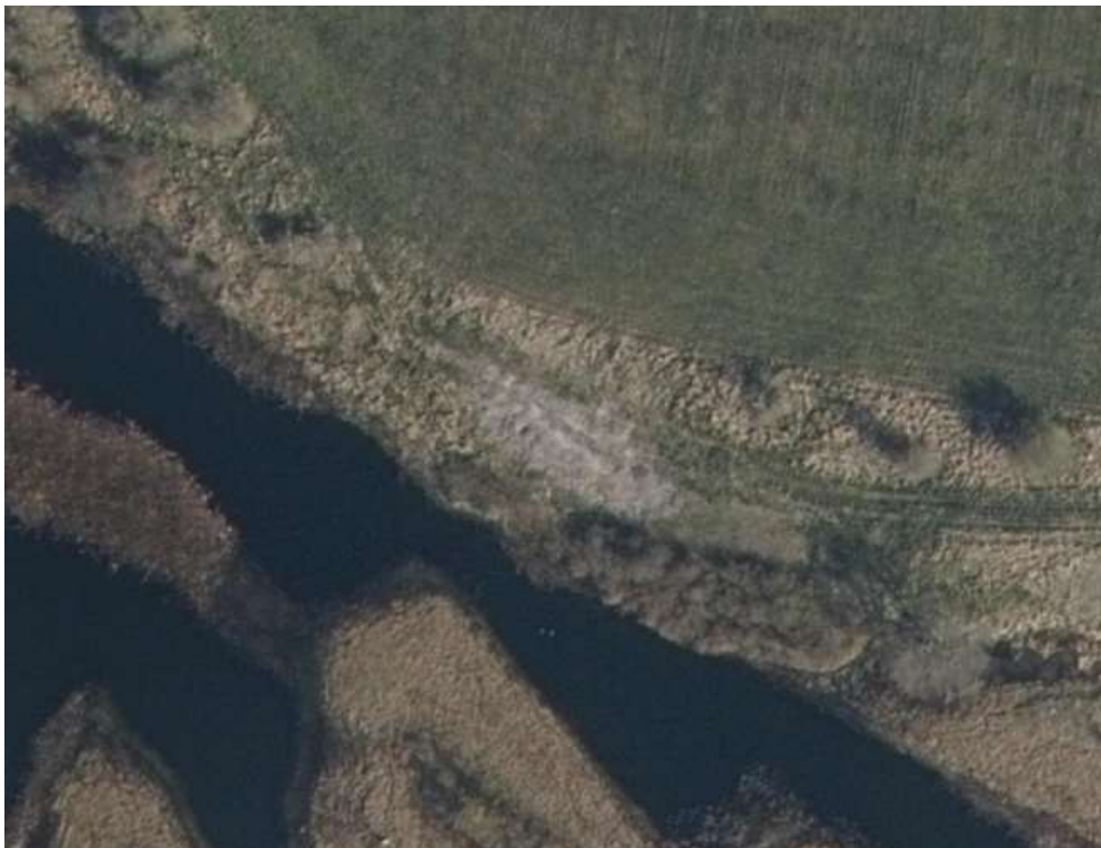
Luftfoto fra forår 2020. Der ses blottet jord midt i billedet efter udskiftning af rævegraven.